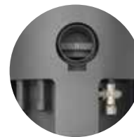
Wasseranschluss nach hinten oder unten