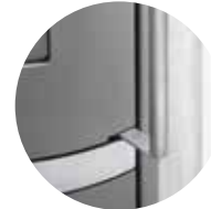
Luftdurchströmer Stangengriff mit Snap-Lock-System