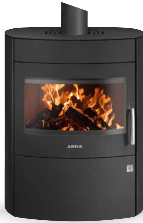
Agero 2.0 Stahl Schwarz