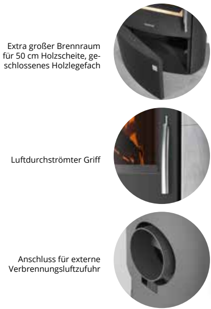
Extra großer Brennraum für 50 cm Holzscheite, geschlossenes Holzlegefach

Der Anschlussstutzen ist vormontiert und im Lieferumfang enthalten.