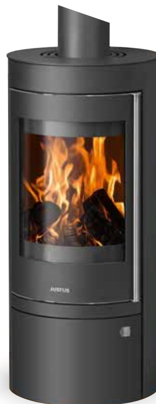
Mino Top 2.0 Stahl Schwarz