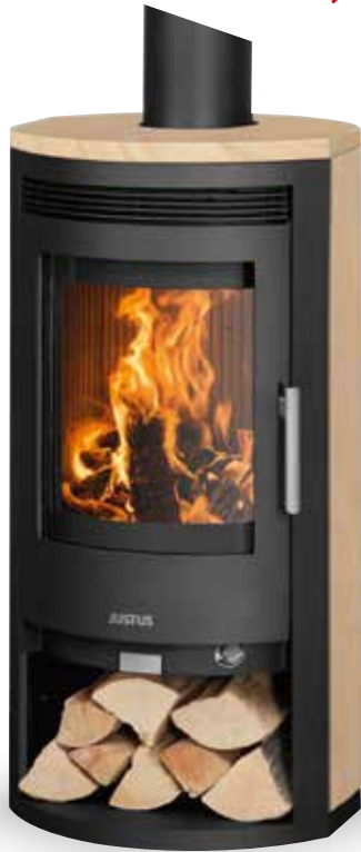
Baltrum D Sandstein, Korpus Stahl Schwarz